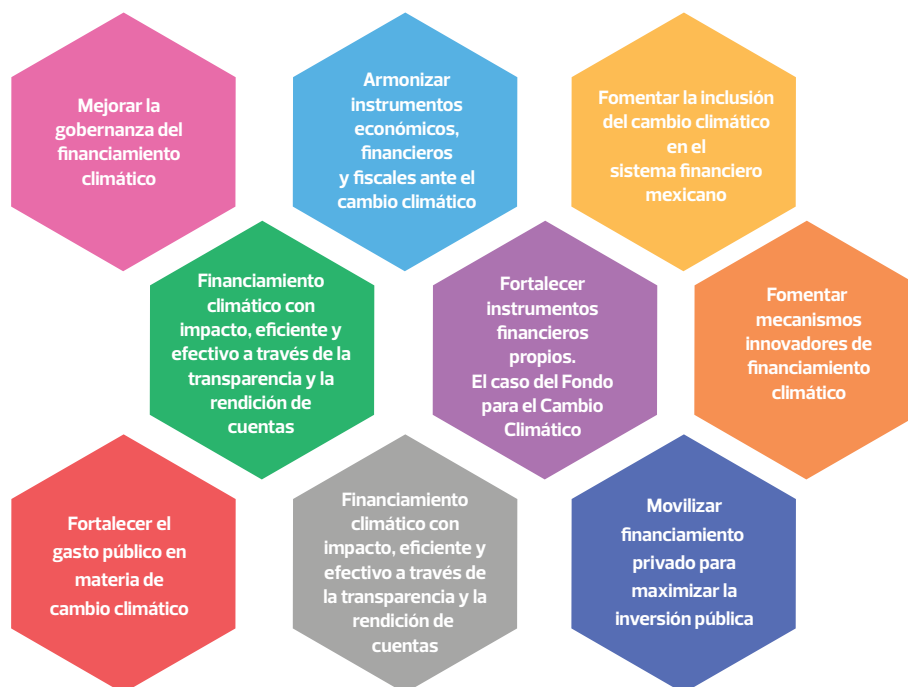
Gráfico 2: Estrategia Nacional de Financiamiento para el Cambio Climático (Objetivos de la EMFC México)

México no cuenta todavía con una ENFC pero sí existe una discusión en torno al contenido de la misma y ya se han dado algunos pasos para su elaboración. El financiamiento está incluido como uno de los cinco pilares del Sistema Nacional de Cambio Climático y está informado por la ley nacional de cambio climático. El enfoque clave para recaudar recursos económicos para la acción climática es a través de instrumentos basados en el mercado. La Alianza Mexicana Alemana (IKI Alliance Mexico, 2019) de Cambio Climático junto con GFLAC propusieron en el año 2019 los siguientes objetivos para una Estrategia de Movilización de Financiamiento Climático (EMFC):